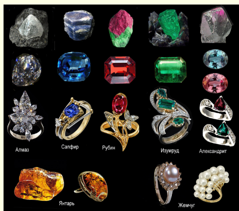
Драгоценные камни в породе и в изделиях